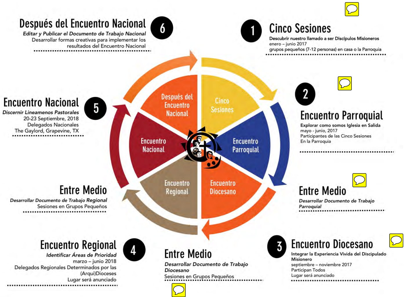
DIAGRAMA DEL PROCESO V ENCUENTRO